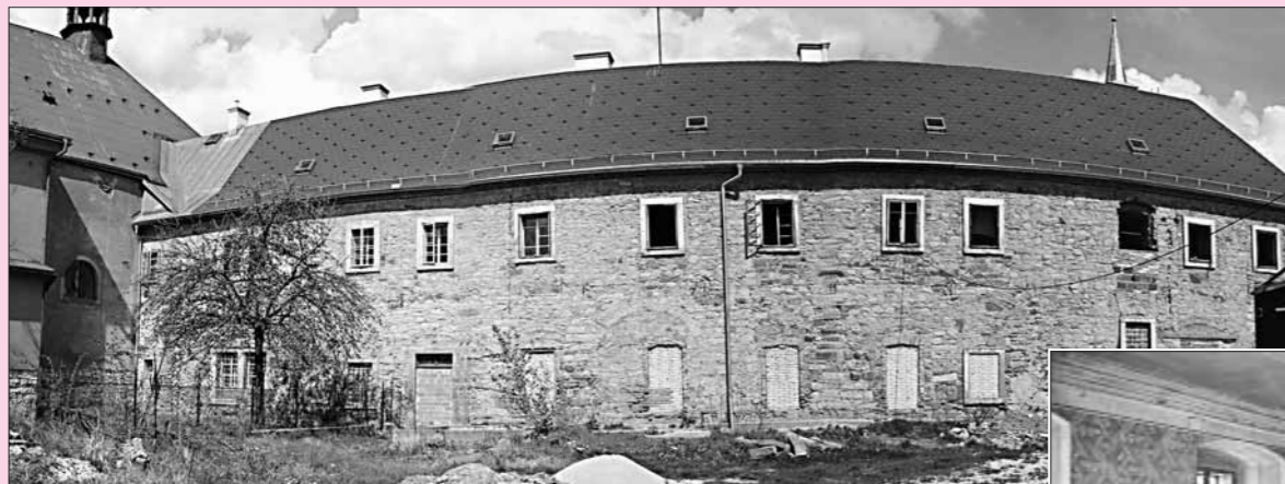
◀ Pohled na klášter z jihovýchodní strany – vlevo část kostela

Rozlehlý areál františkánského kláštera v Hostinném je situován mimo vlastní historické jádro města (které bylo v roce 1990 prohlášeno Městskou památkovou zónou) při jeho severovýchodním okraji. Jedná se o nepravidelný pozemek obehnaný zdí na rubu členěnou arkádami. Při západním nároží pozemku je umístěn dvoulodní kostel, k němuž v cca 11metrovém úseku přiléhá patrová budova konventu. Severozápadně od kostela se rozkládá hřbitov.