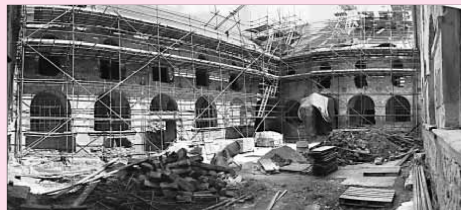
Pohled do rajského dvora kláštera není dnes nijak povzbudivý. Podarí se sehnat na záchranu této raně barokní památky finanční prostředky?

V jednotlivých místnostech konventu byla instalována kamna, do kterých se přikládalo