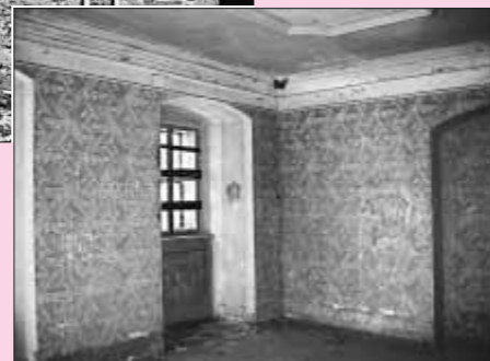
Interiér jedné z dochovaných místností naznačuje původní barevnost stěn. Průzkum dokládá až 26 vrstev barokních nátěrů...

Zjištění působnosti Wolfganga Dientzenhofera při stavbě v Hostinném je vysoce zajímavým objevem. Tento starší bratr v poslední do-