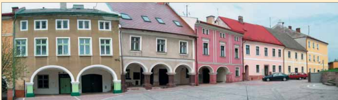
Na panoramatické fotografii je zachycena severozápadní fronta měšťanských klasicistních domů na podloubí č. p. 30, 31 a 32 na náměstí a dále domů č. p. 33, 34 a 35 bez podloubí. Tento hodnotný architektonický soubor je mírně znehodnocen nevhodnými novodobými střešními okny na střeše domu č. p. 31