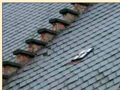
Jeden z architektonicky cenných detailů – pozdně klasicistní členěné střešní okno na domě č. p. 10

Nejcennějším prvkem, pro který byla Městská památková zóna v Pilníkově vyhlášena, je soubor klasicistní zástavby okolo náměstí (včetně objektů, které nejsou zapsanými kulturními památkami), jehož charakter se více či méně uchoval od ničivého požáru z roku 1820 až do současnosti. Jedná se totiž o „novostavby“ postavené brzy po požáru, které si zachovaly původní hmotové, výškové, konstrukční a prostorové uspořádání. Objekty byly ve druhé polovině 19. a v první polovině 20. století upravovány, ale úpravy byly pouze kosmetické a v mnoha případech již tyto úpravy také přispívají k památkové podstatě jednotlivých objektů. Například u domu č.p. 10 se dochovala starší šindelová