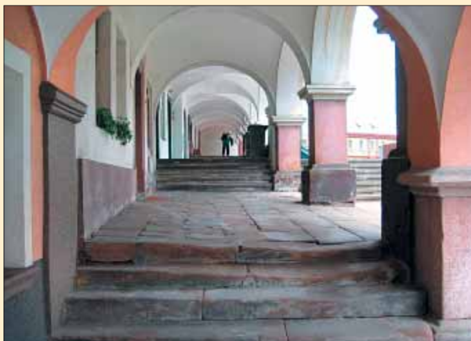
Nejstarší pískovcová dlažba v podloubí měšťanských klasicistních domů č. p. 28 a 29, na náměstí již řádně prošlapaná