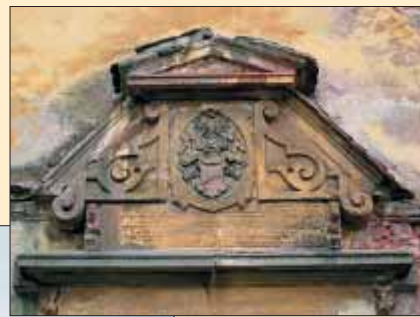
Nad vstupem do podvěží je umístěna kamenná, bohatě zdobená supraporta doplněná plastickým erbem Beatrix Eleonory z rodu Zilvarů, která kostelní věž v letech 1604–1605 postavila

Na staré komunikaci při jižní frontě náměstí se dochovaly fragmenty dvou historických dlažeb. Jedná se o zádlazbu tzv. vějířové čedičové dlaž-